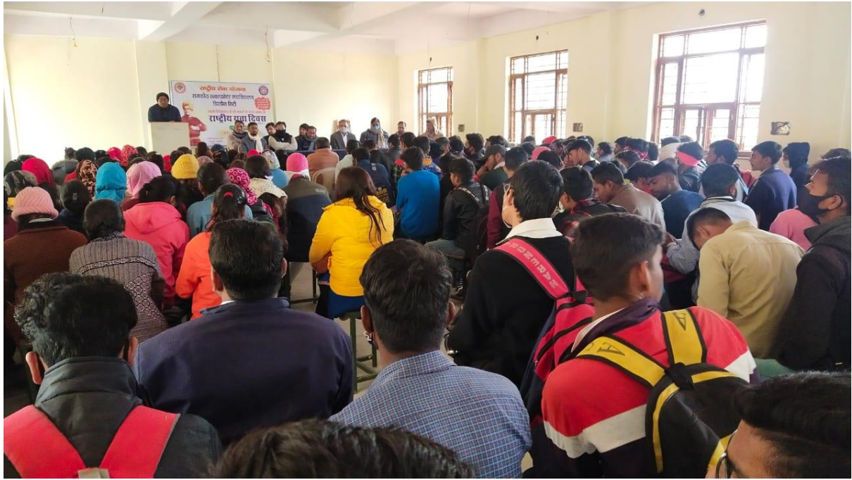
Motivational Seminar on Youth Day